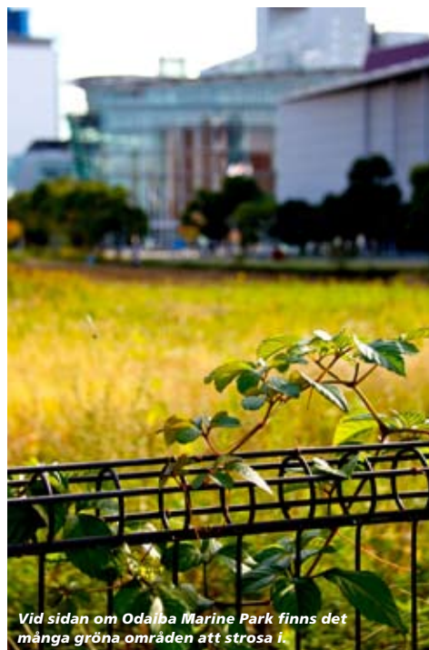
Vid sidan om Odaiba Marine Park finns det många gröna områden att strosa i.