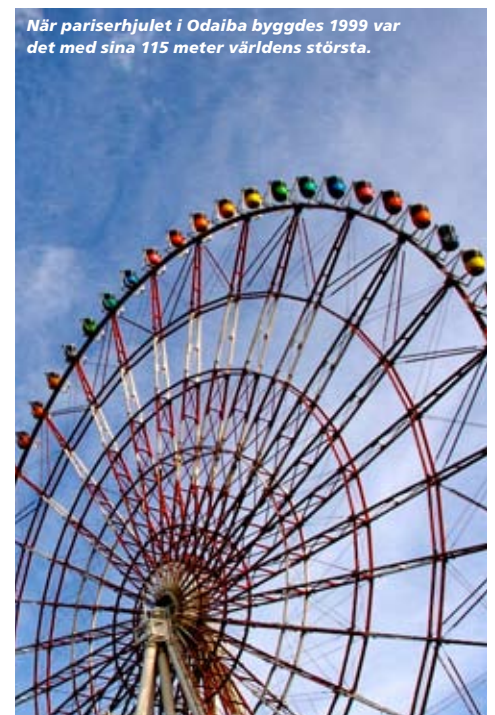
När pariserhjulet i Odaiba byggdes 1999 var det med sina 115 meter världens största.