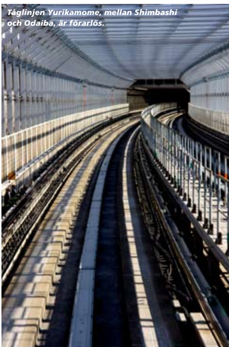
Tåglinjen Yurikamome, mellan Shimbashi och Odaiba, är förrärlös.

Skönast är det emellertid att göra som de otaliga nyförälskade paren. Ta en långsam promenad längs den artificiella sandstranden i Marine Park och njut av en picknick i gröngräset medan solens sista strålar sänker sig över en av världens mest magnifika stadssilhuetter som förföriskt glittrar i vattnet. ●